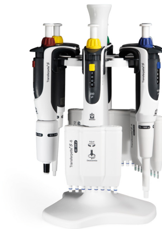
Tischständer Tischständer für 6 Transferpette® S Ein- oder Mehrkanalpipetten.