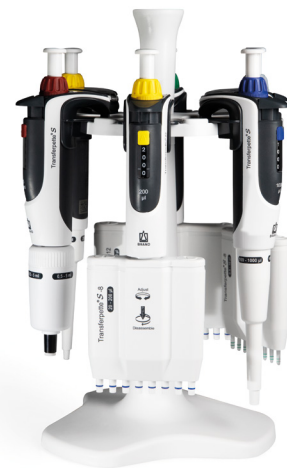
Tischständer Tischständer für 6 Transferpette® S Ein- oder Mehrkanalpipetten.