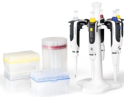
Abb. Pipetten-Paket 2