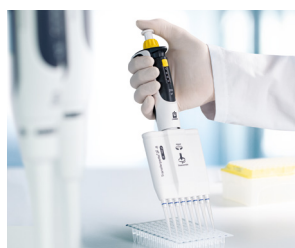
Arbeiten mit PCR-Platten