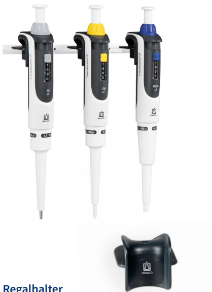
Regalhalter für 1 Transferpette® S Ein- oder Mehrkanalpipette.

Mit den Haltern und Ständern sind die Geräte immer fachgerecht aufbewahrt und griffbereit für den nächsten Einsatz.