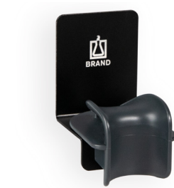
Wandhalter für 1 Transferpette® S Ein- oder Mehrkanalpipette.