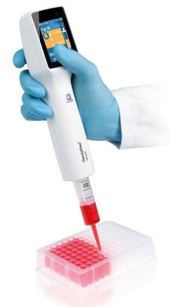
Multi-Dispensieren mit dem HandyStep® touch und PD-Tip //

Der HandyStep® touch spart Zeit und vermeidet Fehler durch die automatische Größenerkennung der PD-Tips // von BRAND mit patentierter Codierung am Kolben. Nach dem Einsetzen wird die erkannte Tip-Größe automatisch angezeigt. Das zu dosierende Volumen kann nun schnell und einfach ausgewählt werden. Die Geräteeinstellung bleibt beim Einsetzen eines neuen PD-Tips gleicher Größe erhalten.