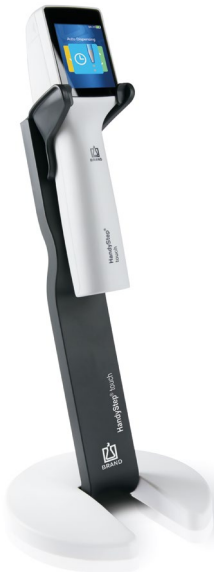
Halteständer mit HandyStep® touch