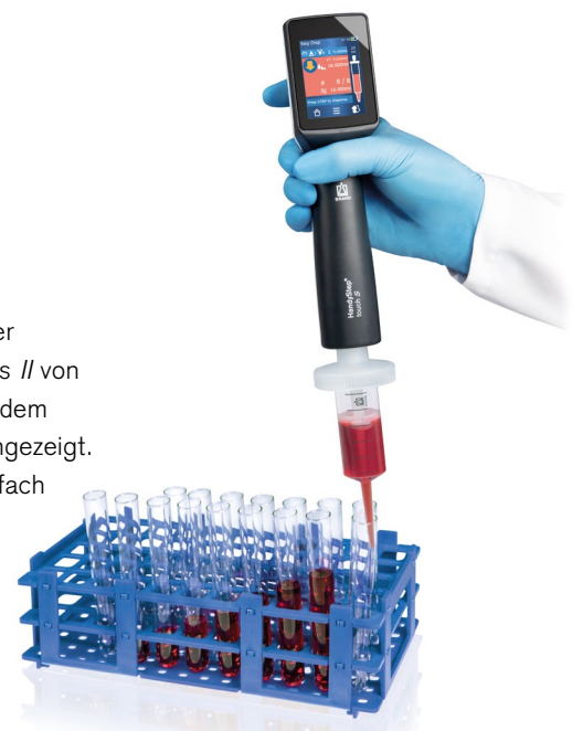
Sequentielles Dispensieren mit dem HandyStep® touch S und PD-Tip //