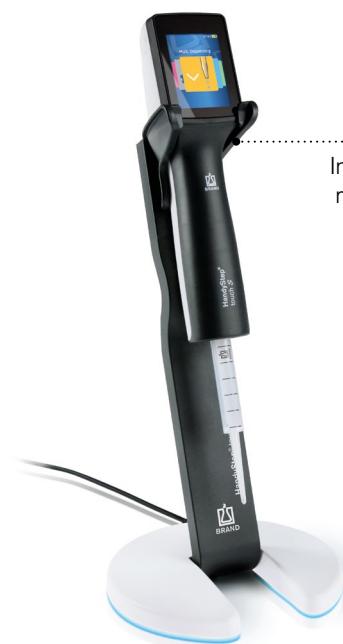
Ladeständer mit HandyStep® touch S und PD-Tip //